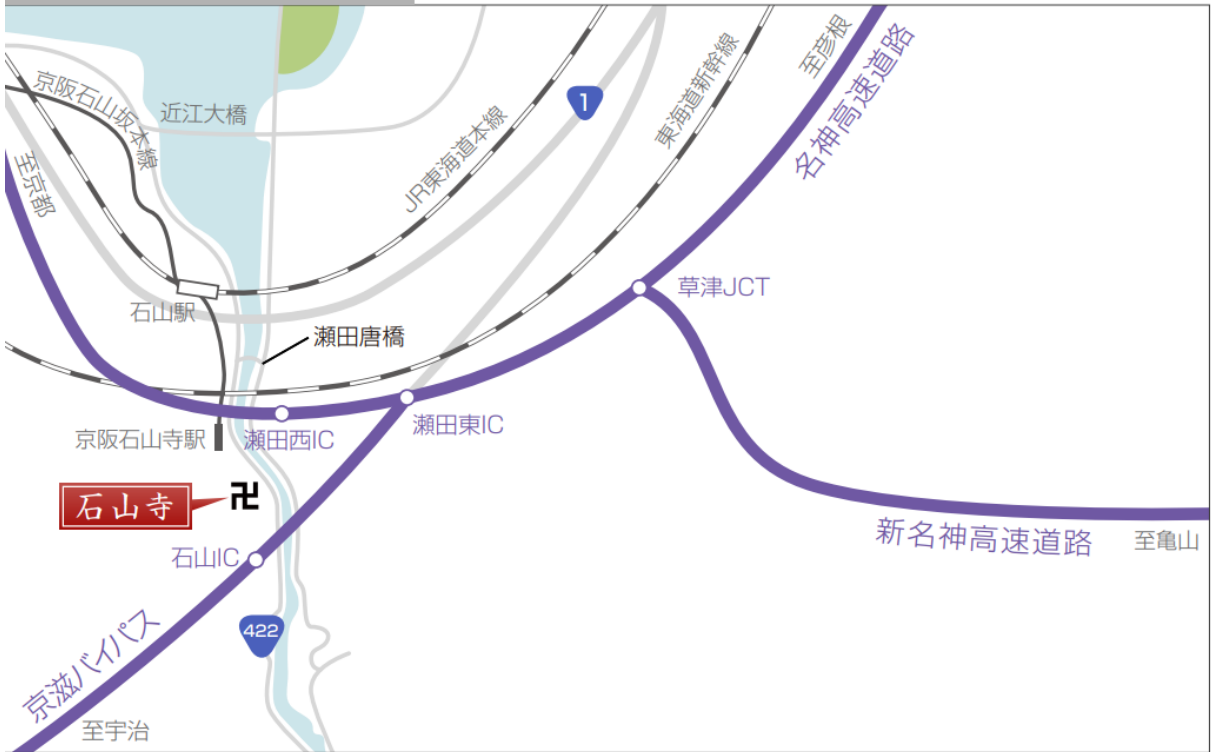
車でお越しの方（周辺地図）