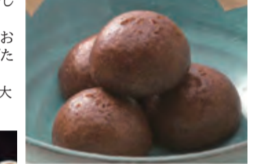
花梨糖饅頭 (1個 129円)

☐営業時間 10時～16時30分 ※季節によって夜間営業もあります ☐休日 不定休