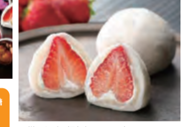
王様いちごの福(1個 464円)

☐営業時間 10時～17時 ※季節によって夜間営業もあります ☐休日 なし(催事出店の場合不定休あり)